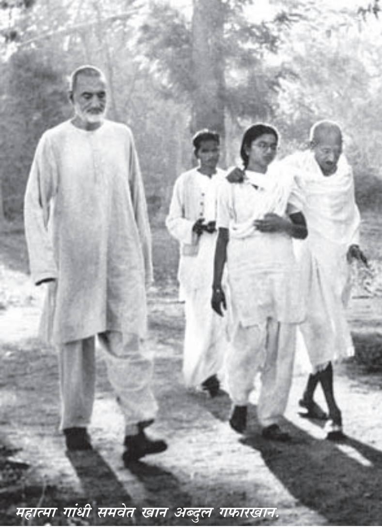
महात्मा गांधी समवेत खान अब्दुल गफारखान.

भारतीय संशोधकांपुढे आव्हान आहे ते जमिनीवर पाय घट्ट रोवून दूरस्थ अवकाशातील तारे शोधण्याचे. मग तो अंतराळ मोहिम असो वा चांद्रयान, पिण्याच्या पाण्याचा प्रश्न असो वा अन्य काही. ही सर्व मोठमोठी कामे आपल्याला पाय जमिनीवर ठेवूनच करावी लागणार आहेत. डॉ. विजय भटकर यांनी सी-डॅकमध्ये परम महासंगणक तयार केले तेव्हा ही विशिष्ट भावनाच त्यांच्या कामी आली होती. आता आपण 'टेराफ्लॉप्स' कडून 'पेटाफ्लॉप्स'कडे जाण्याच्या प्रयत्नात