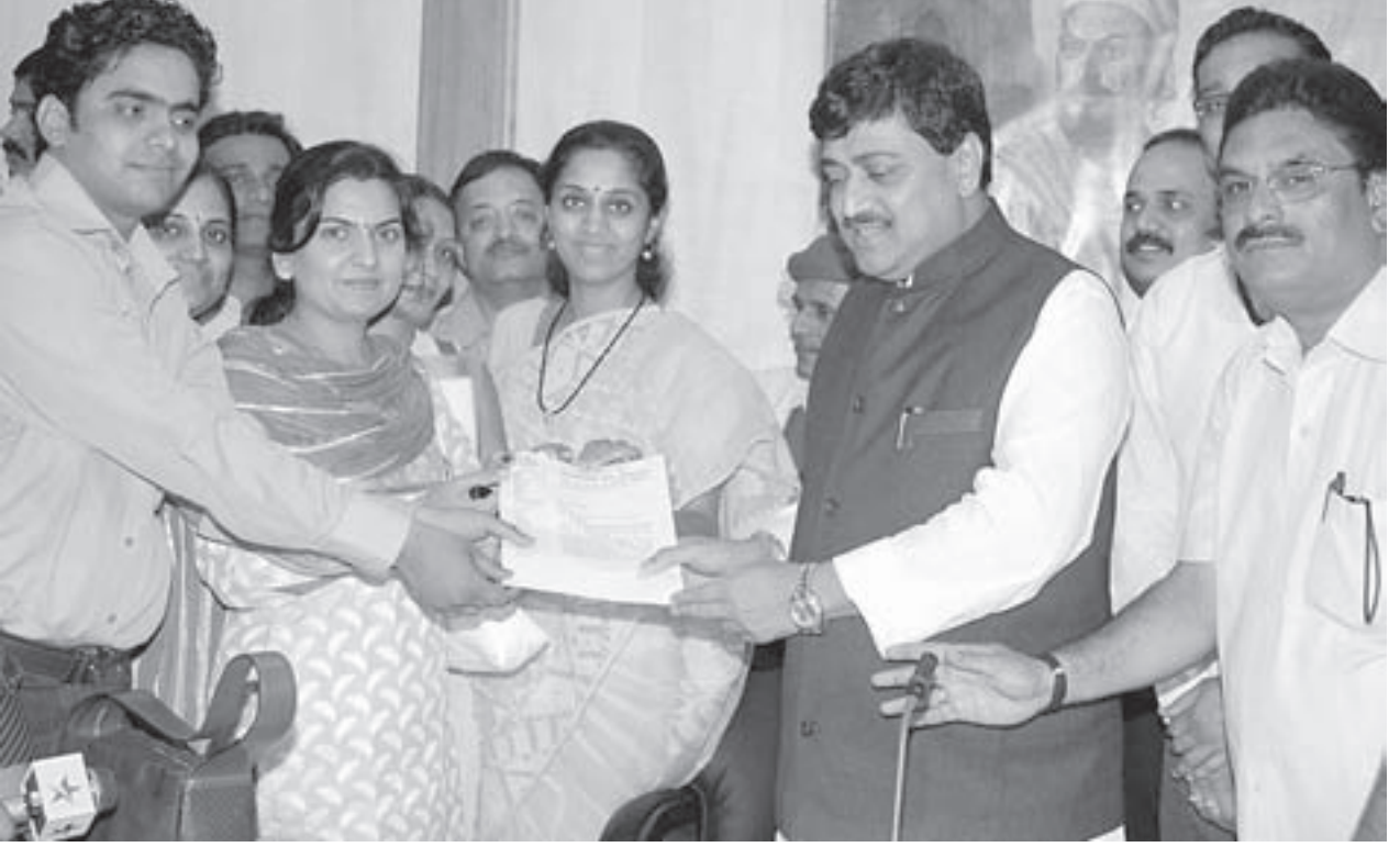
युवा धोरण जाहीर करण्यासाठी खासदार सुप्रियाताई सुळे यांच्या नेतृत्वाखालील शिष्टमंडळाने मुख्यमंत्री अशोक चव्हाण यांची भेट घेऊन त्यांना एक लेखी निवेदन दिले.

भारतीय लोकसंख्या विज्ञान संस्थेचे अहवाल, इतर संस्थांतर्फे प्रकाशित करण्यात आलेले अहवाल, क्रीडा व युवक कल्याण खात्याच्या योजना या सर्व बाबींचा अभ्यास करून या युवा धोरणाचा प्राथमिक मसुदा तयार केला. दि. १२ जून ०९ रोजी यशवंतराव चव्हाण प्रतिष्ठान, मुंबई येथे युवा धोरण माहिती परिषद घेण्यात आली. या परिषदेत अभियानाच्या निमंत्रक मा. सुप्रिया सुळे यांनी राज्य शासनाने युवा धोरण जाहीर करावे, अशी विनंती राज्य शासनाकडे करावी. त्याच दिवशी विधानभवनात नवमहाराष्ट्र युवा अभियानाच्या शिष्टमंडळासह मुख्यमंत्री मा. अशोकराव चव्हाण व उपमुख्यमंत्री मा. छगनराव भुजबळ यांची भेट घेऊन राज्य शासनाने युवा धोरण जाहीर करावे, याबाबतचे निवेदन त्यांना सादर करण्यात आले. यानंतर दि. ८ ऑगस्ट ०९ रोजी महाराष्ट्र राज्य युवा धोरण जाहीरनामा उपक्रमांतर्गत राज्याच्या युवा धोरणाचा प्राथमिक मसुदा यशवंतराव चव्हाण प्रतिष्ठान येथे महाराष्ट्रातील शेकडो युवक-युवतींच्या उपस्थितीत एका शानदार कार्यक्रमात उपमुख्यमंत्री मा. छगनराव भुजबळ, क्रीडा व युवक कल्याण खात्याचे मंत्री मा. डॉ.