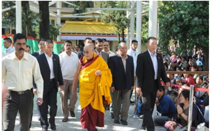
दलाई लामा यांची अरुणाचलला भेट

महाराष्ट्राव्यतिरिक्त हरियाना व अरुणाचल प्रदेशात झालेल्या विधानसभांच्या निवडणुकांपैकी अरुणाचल मधील काँग्रेसचे दोन तृतीयांश बहुमत अपेक्षित होते. निवडणुकीच्या ऐन पूर्वसंध्येवर चीनने अरुणाचलवर दावा केल्याने स्थिर सरकार देणाऱ्या काँग्रेसकडे मतदार सुरक्षिततेच्या दृष्टीने वळला. मुख्यमंत्री दोरजी खंडू यांचे स्थान विधानसभेच्या एकूण ६० जागांपैकी ४२ जागा मिळून आणखी भक्कम झाले. चीनला लोकशाही प्रक्रियेने एक चपराक दिली. पंतप्रधान अरुणाचलमध्ये प्रचार दौऱ्यावर गेले, तेव्हाही चीनने कोल्हेकुई केली. तिला सरकारने भीक घातली नाही, की तवांगला पुढील महिन्यात भेट देणाऱ्या